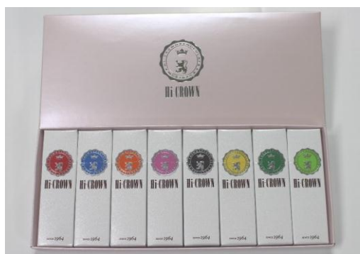
← 桜色の限定化粧箱入り 8本入り 2,000円(税別)