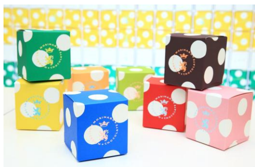
↑ 15本入り 各3,700円

重なるご好評を受けて、この桜の季節に、国内はもちろん海外からの観光客も多く集まり、日本の新しいファッション、スイーツのトレンド情報発信地である銀座に出店し、桜をあしらった美しいパッケージと共に、進化を続ける新しい日本のチョコレート「ハイクラウン」を日本から世界のお客様へのご提案してまいります。