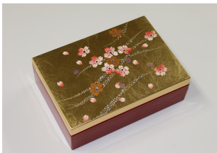
↑ 桜をあしらった金沢箔のジュエリーケースのセット 5本入り 6,800円(税別)