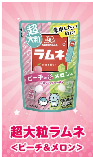
超大粒ラムネ <ピーチ&メロン>

「森永ラムネ」シリーズにより、受験生を応援するとともに、お客様に笑顔をお届けしてまいります。