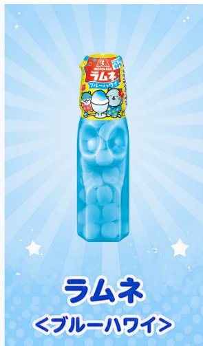
ラムネ <ブルーハワイ>