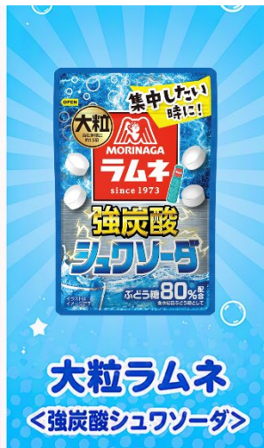
大粒ラムネ <強炭酸シュワソーダ>