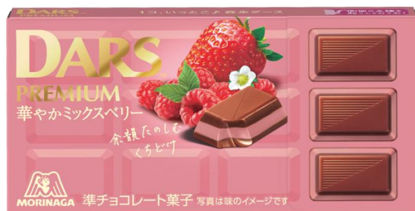
▲ダースプレミアム＜華やかミックスベリー＞

とろけるようなバニラの余韻を感じるチョコレートを、やさしいミルクのkokを楽しめるチョコレートでサンド