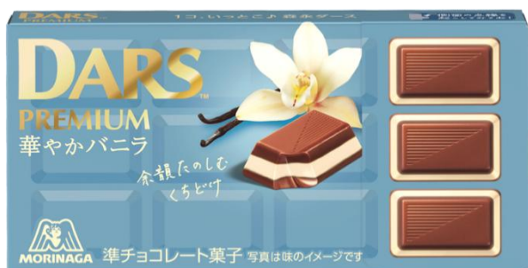
▲ダースプレミアム＜華やかバニラ＞

「ダースプレミアム＜華やかバニラ＞」は、やさしいミルクのkok深いチョコレートとバニラの余韻を感じる 3 層仕立てのプレミアム品質な「ダース」です。「ダースプレミアム＜華やかミックスベリー＞」は、やさしいミルクのkok深いチョコレートと、ミックスベリーの甘酸っぱさが相性抜群です。華やかな味わいと余韻が楽しめる、バレンタイン時期にぴったりな商品の発売で、お客様に笑顔をお届けしてまいります。