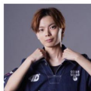
Good 8 Squad所属 さはら