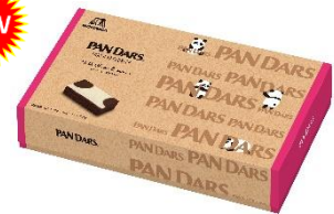
パンダース ミルクチョコブラウニー