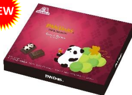
パンダースギフト くらム&レーズン