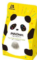
パンダース パチパチキャンディチョコレート