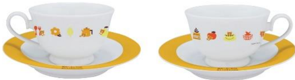
ティーカップペアセット