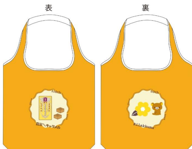
キャラメルキーホルダー付き エコバック