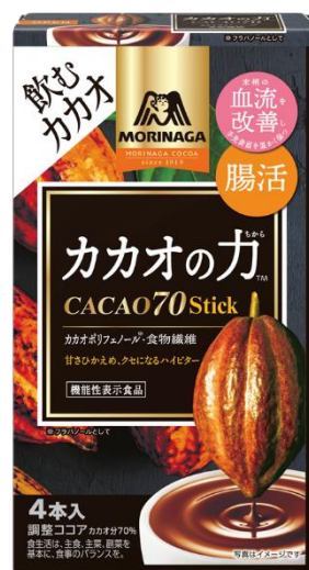
カカオの力 <CACAO70> スティック