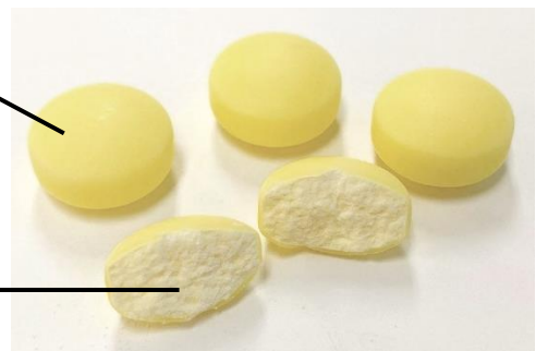
▲「バリボリラムネ<グレープ味>」