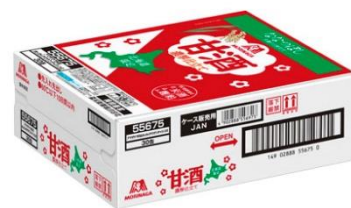
▲「甘酒 北海道限定仕込み」段ボールケース