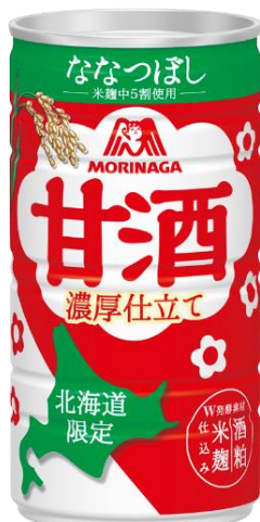
▲「甘酒 北海道限定仕込み」