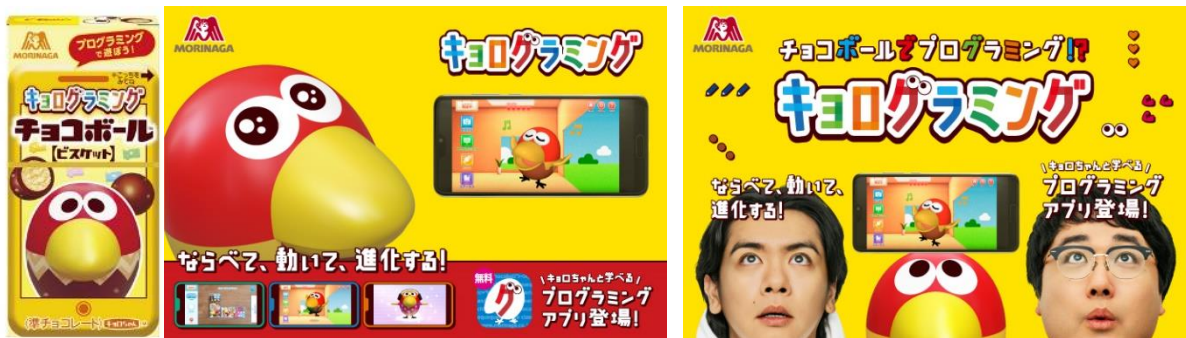
▲キョロプログラミングチョコボール<ビスケット>・キョロプログラミングビジュアル

新しい視点での新商品の発売や、話題性のあるキャンペーンなど、様々な企画で「チョコボール」がチョコレート市場をさらに盛り上げてまいります。