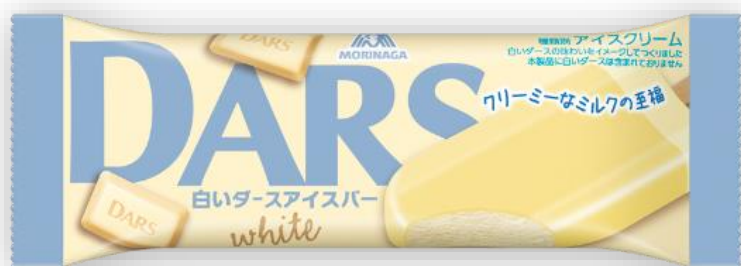
クリーミーな味わいのホワイトチョココーティング