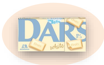
◀ご参考「白いダース」