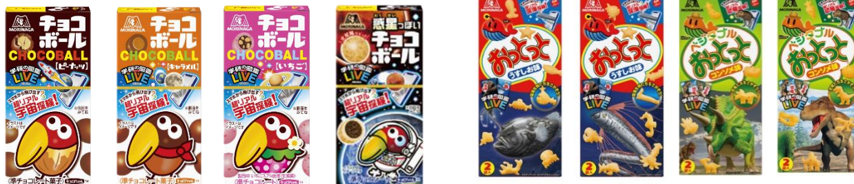
▲『学研の図鑑LIVE』とのコラボ商品の一部「チョコボール」「おっとっと」「ベジタブルおっとっと」

おうち時間を親子やお友達とともに学び、お楽しみいただける「チョコボール」「おっとっと」で市場を盛り上げてまいります。