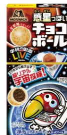
▲惑星っぽいチョコボール<火星風チョコビス>

「チョコボール」は1967年に発売以来、お子様から大人まで幅広い年代にご愛顧いただいている商品です。この度の「惑星っぽいチョコボール<火星風チョコビス>」では、『学研の図鑑LIVE』シリーズの中でも人気の「宇宙」とコラボし、ココアビスケットを橙色のまだら模様をついたミルク風味チョコでコーティングした見た目が火星っぽい「チョコボール」に仕立てました。