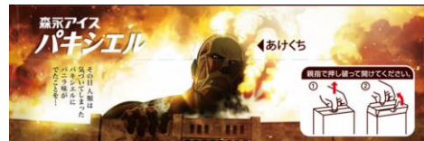
▲パッケージデザインの一部