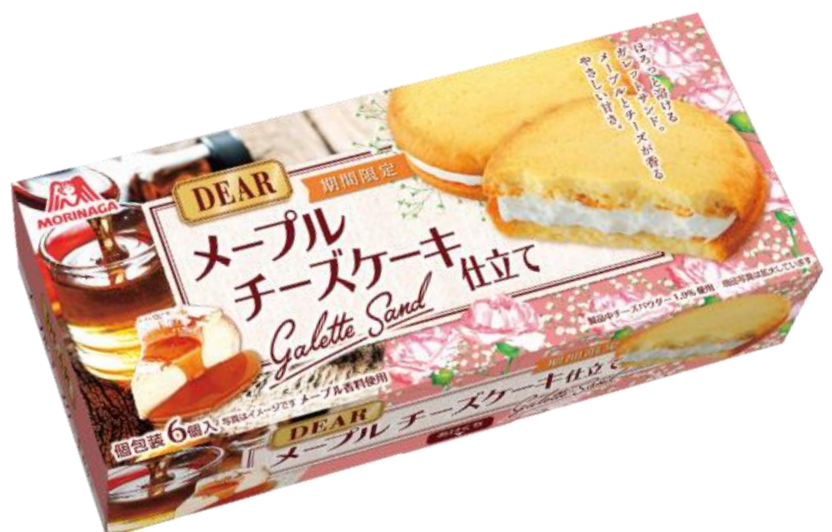
▲ディアガレットサンド