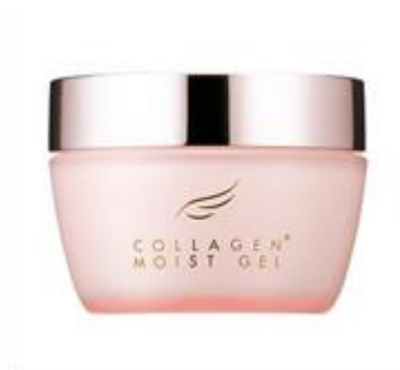
▲コラーゲンモイストジェル