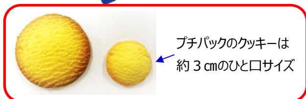
プチパックのクッキーは 約3cmのひと口サイズ