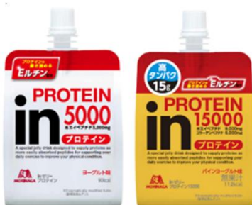
『i nゼリープロテイン』シリーズ

「エルチン」を配合したリニューアル商品および新商品を通じて、皆様の効率的なカラダづくりをサポートいたします。