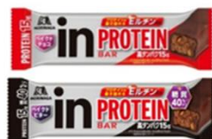
『i nバープロテイン』シリーズ