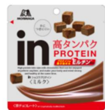
『i nショコラプロテイン<ミルク>』