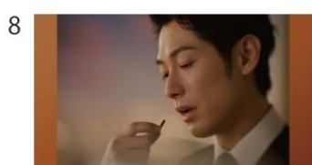
ミルク感、カカオ感。