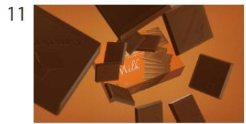
チョコレートの完成形。