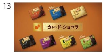
SL：カレ・ド・ショコラ