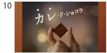
そう、カレ・ド・ショコラ。