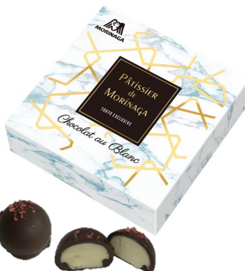
▲Chocolat au Blanc (ショコラ オ ブラン)