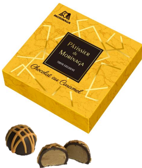
▲Chocolat au Caramel (ショコラ オ キャラメル)