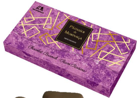
▲Chocolat Branch<Ram Raisins> (シヨコラ ブランチ<ラムレーズン>)