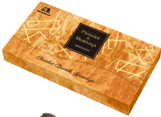
▲Chocolat Branch<Gianduja> (シヨコラ ブランチ<ジヤンドゥーヤ>)