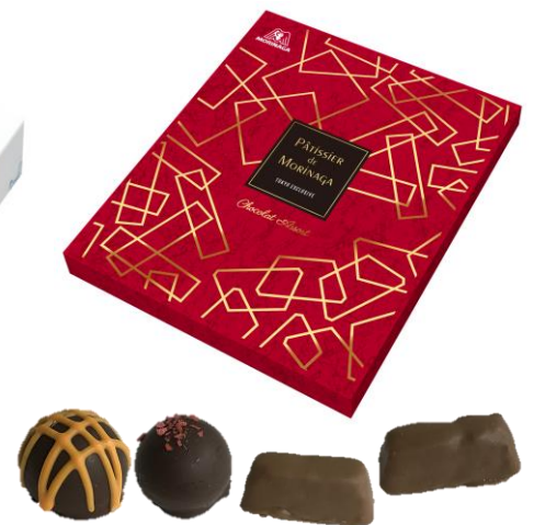
▲Chocolat Assort (ショコラ アソート)