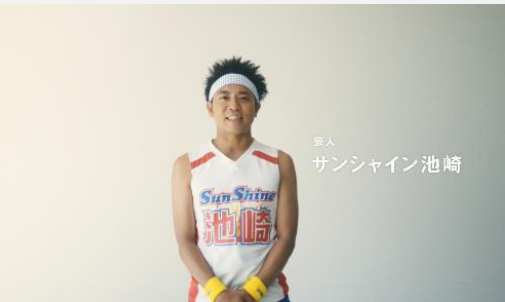
登場 サンシャイン池崎