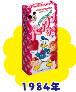
▲初代パッくんチョコ＜イチゴ＞