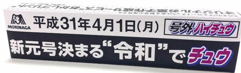
▲サンプリングする新元号デザインの「ハイチュウ」

「令和ハイチュウ」は、小ロット・短納期でオリジナルお菓子が作れる、ノベルティお菓子サービス『おかしプリント』で作成しました。「おかしプリント」の詳細はこちら https://okashiprint.com/