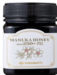
岩谷産業(株)が輸入販売する オーストラリア産マヌカハニー