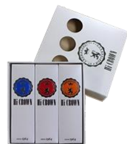
▲ハイクラウン通常品