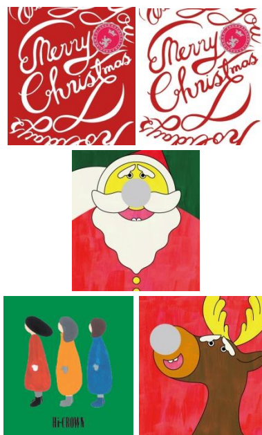
▲クリスマスデザイン (11月末~予定)