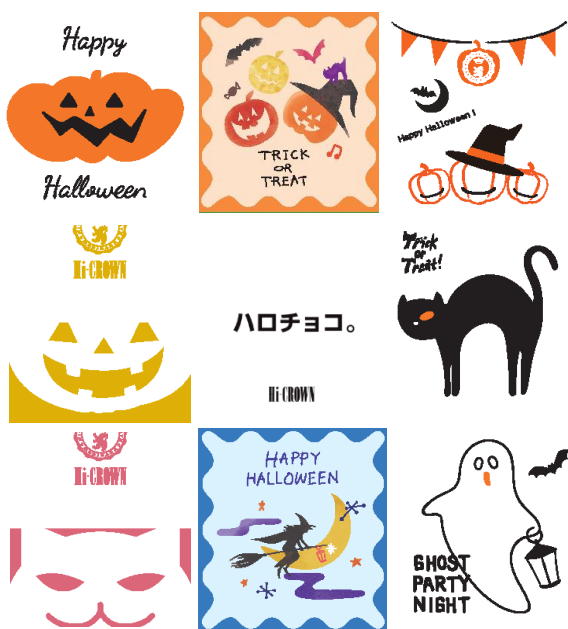
▲ハロウィンデザイン

1899年、西洋菓子がまだなじみのない時代に、森永製菓の創業者 森永太郎が“美味しいお菓子を多くの日本人々に届けたい”その創業者の熱い想いを現代に新しくカタチにした「TAICHIRO MORINAGA」が、現代アートとの競演で新しくイベントを彩ります。