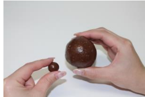
▲通常のチョコボールと50倍との比較