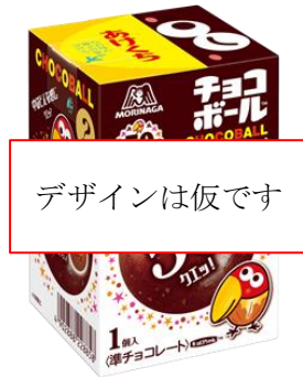
▲発売当時の「50倍チョコボール」