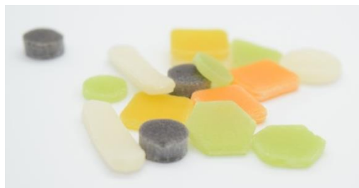
▲1時間以上溶けない食品素材LSA(エルサ)