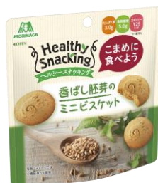
▲ヘルシースナッキング <香ばし胚芽のミニビスケット>