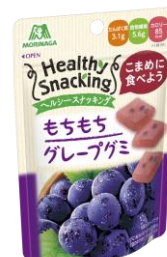
▲左)ヘルシースナッキング<もちもちグレープグミ> 右)ヘルシースナッキング<もちもちレモングミ>