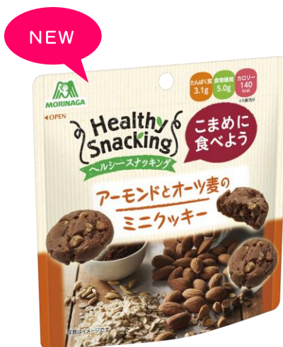
▲ヘルシースナッキング <アーモンドとオーツ麦のミニクッキー>

(ご参考:ヘルシースナッキング情報サイト http://www.morinaga.co.jp/healthysnacking/ )