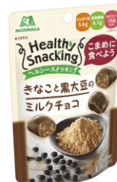
▲ヘルシースナッキング <きなこ黒大豆のミルクチョコ>