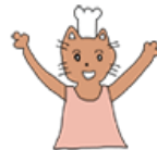
▲しおひがりさんのイラスト