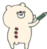
▲小鳥遊しほさんのイラスト