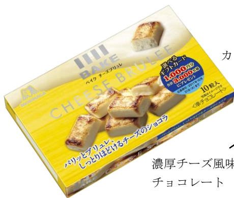
カリカリとしたキャラメリゼ層

しっとりした食感と濃厚な味わいが一息つく時に、ちょっとした気分転換に、疲れを癒してくれるご褒美ショコラとして、春夏の焼きチョコ市場を盛り上げてまいります。