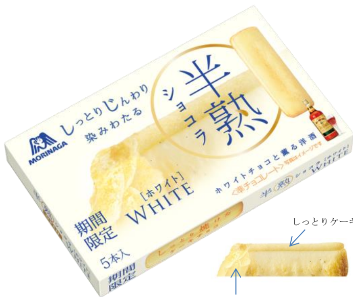
▲半熟ショコラ<ホワイト>

大人の皆様に、ひとときのリラックスを提供する癒しのショコラとして、この初雪の季節限定の美味しさのホワイトチョコレートでチョコレート市場を席卷してまいります。