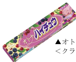
▲オトナハイチュウ <クランベリー&ブルーベリー>