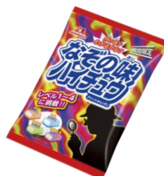
▲なぞの味ハイチュウアソート

■このキャンペーンでしか手に入れることの出来ない『ハイチュウオリジナル 関ジャニ∞プレイキューブ』