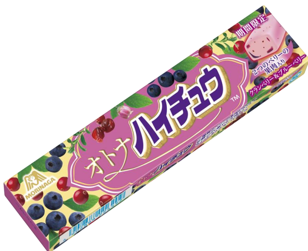
▲オトナハイチュウ 〈クランベリー&ブルーベリー〉