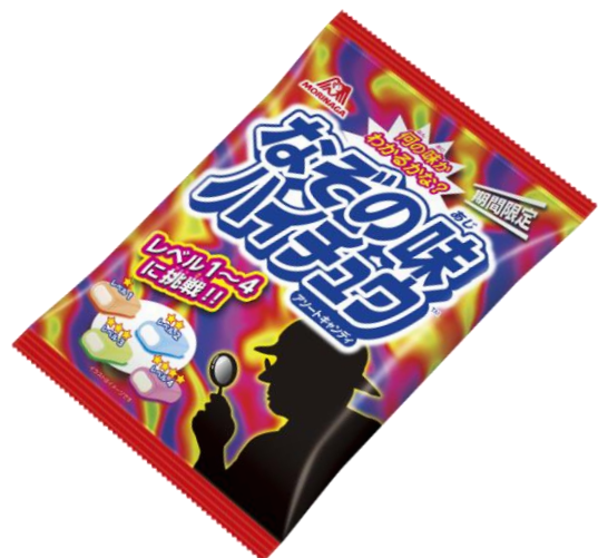
▲なぞの味ハイチュウアソート