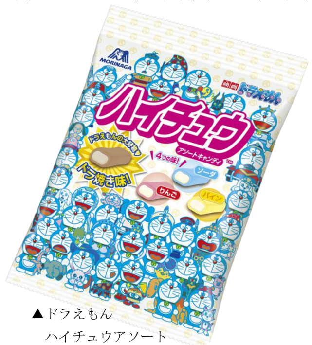
▲ドラえもん ハイチュウアソート