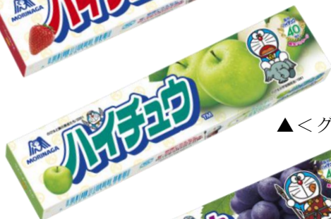
▲<グリーンアップル>