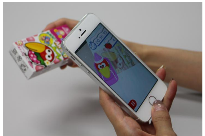
▲ チョコボールARtoy を体験している様子

「チョコボール AR toyシリーズ」は、森永アクセラレータープログラム※2で、「アライアンス賞」を受賞した、法政大学岩月教授率いるスマートマシンデザイン研究所がNTTドコモの支援を受けて開発した世界初の重力を感じるARを搭載した、産学コラボレーション商品です。