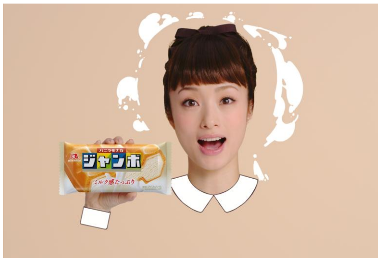
バニラモナカジャンボ「バニラリンボー！」篇