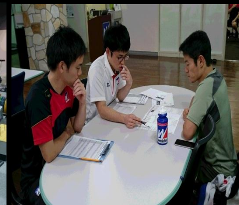
公認スポーツ栄養士による指導