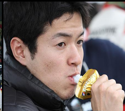
試合中は、inゼリーゴールド でエネルギー補給！