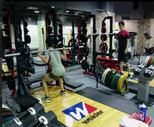
パフォーマンスコーチによるトレーニング指導