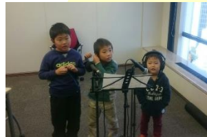
▲イースターソング制作風景