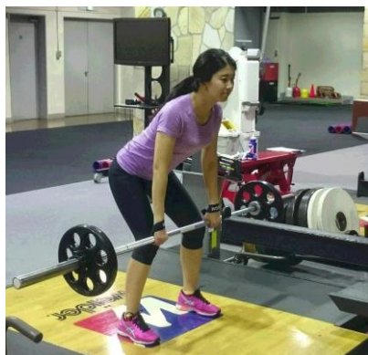
▲森永製菓トレーニングラボでの様子