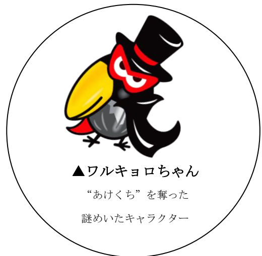
▲ワルキョロちゃん