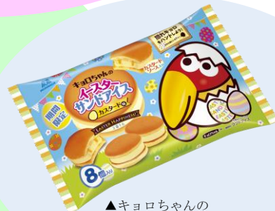
▲キョロちゃん のイースターサンドアイス