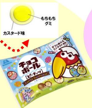
▲チョコボール<ピーナッツ>プチパック ▲もちもちグミ<カスタード味>