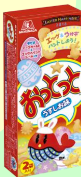
▲おとっとくうすしお味>