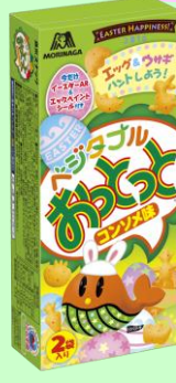
▲ベジタブルおとっとくコンソメ味>