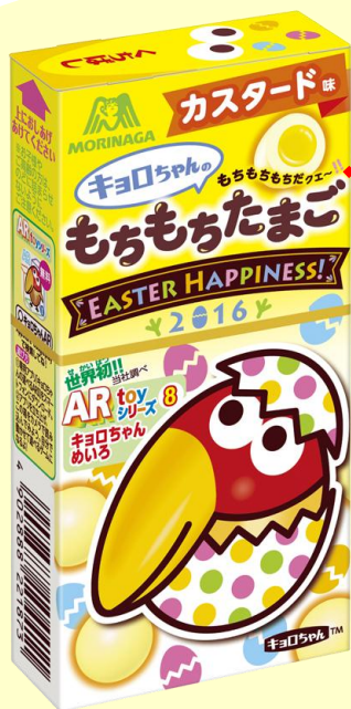
▲キョロちゃんのもちもちたまご<カスタード味>

森永製菓は、菓子と親和性の高い「イースター」に注目し、春の到来をお祝いするとともに、親子や友人とのコミュニケーションツールとして日本の「イースター」を盛り上げてまいります。