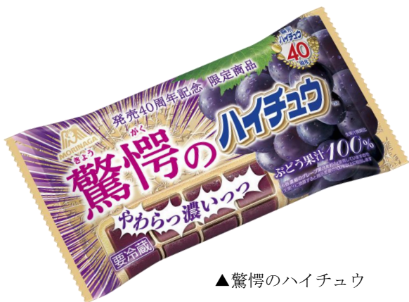
▲驚愕のハイチュウ

「ハイチュウ」は、やわらかな噛み出しと、心地よい噛み応えのジューシーな味わいが楽しめるソフトキャンディで、40年もの長きに渡り、皆様にご愛顧いただいてまいりました。この度40周年を記念して、「ハイチュウ」の技術を最大限に駆使し、「驚愕のハイチュウ」（チルド品）と「謹製ハイチュウ」を開発しました。驚きと楽しさをご提供する「ハイチュウ」でますます40周年を盛り上げてまいります。