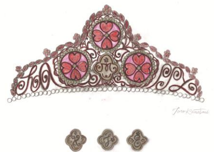
▲紙谷太朗氏による「DARS ティアラ」スケッチ