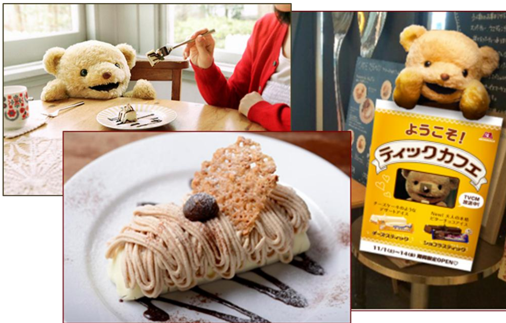
限定デザート「チーズスティックのモンブラン仕立て」

森永製菓株式会社（東京都港区芝、代表取締役社長・新井 徹）は、11月1日（土）～11月14日（金）の期間限定で、森永アイス「チーズスティック」と有楽町マルイ内の『ブラッスリー・カフェ Skew』とのコラボレーションカフェ、『ティック・カフェ』をオープンいたします。