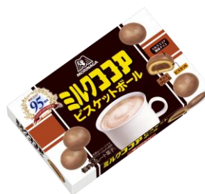
ミルクココアビスケットボール