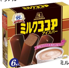
ミルクココアアイスバーマルチ