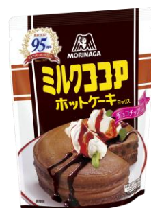
ミルクココアホットケーキミックス <チョコチップ入り>