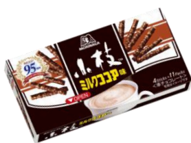
小枝<ミルクココア味>