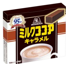
ミルクココアキャラメル