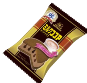
ミルクココアサンドアイス