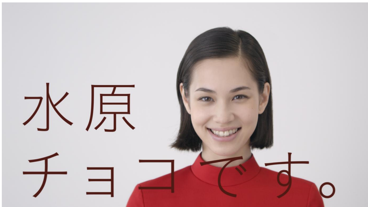
「ダース 水原チョコ」篇

森永製菓株式会社(東京都港区芝 代表取締役社長・新井徹)は、ロングセラーの粒チョコレート、「ダース」の新 CM キャラクターに女優の水原希子さんを起用し、新 CM「ダース 水原チョコ」篇(15秒/30秒)を2014年10月2日(木)より順次、全国にて放映してまいります。