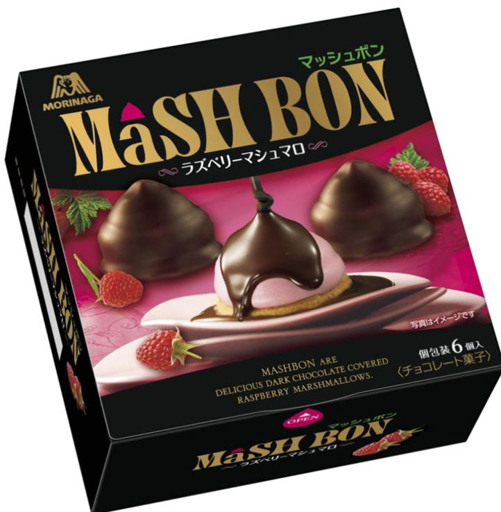
ムースのような食感のラズベリーマシュマロ

マシュマロは、1899年の森永製菓創業時に最も力を入れていた商品です。アメリカでは「エンゼル・フード」と呼ばれていたことから、エンゼルをコーポレートマークにも取り入れました。現在ではマシュマロを用いた「エンゼルパイ」が1961年の発売以来、多くの皆様にご愛顧いただいています。マシュマロについて長年にわたり蓄積された製造技術や製造設備で、ムースのようにしっとり繊細な口どけのマシュマロ、チョコレート、ビスケットを組み合わせた新食感の菓子が実現できました。当社ならではのノウハウを活かした本商品の発売により、チョコレート市場を盛り上げます。