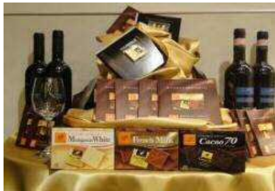
※2012年実施した【カレ・ド・ショコラサンプリング】の画像。現行品のパッケージと変更があります。

商品価値を実感するにふさわしいラグジュアリーな空間のレストラン・バーなどで「カレ・ド・ショコラ」をサンプリングします。特にこの季節のボジュレーヌーヴォーの解禁も合わせて、全国のワインバーやワインの飲めるレストランを中心に展開していきます。