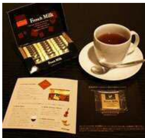
※2012年実施した【カレ・ド・ショコラサンプリング】の画像。現行品のパッケージと変更があります。