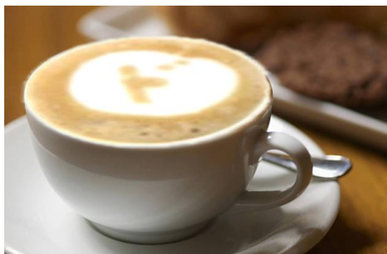
【カレ・ド・ショコラ Bar】