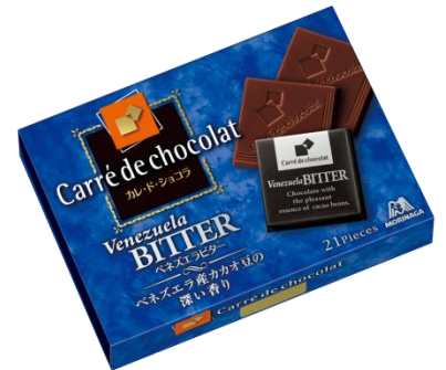
〈ベネズエラビター〉