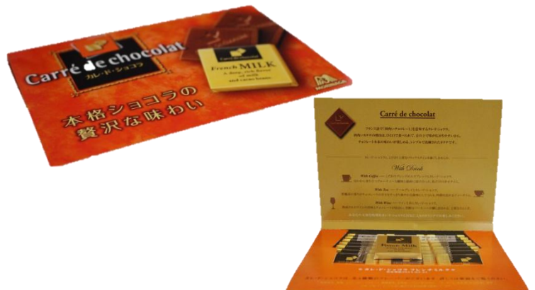
「カレ・ド・ショコラサンプリングキット」