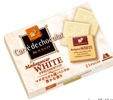
〈マダガスカルホワイト〉