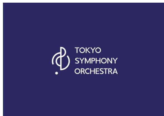
東京交響楽団ロゴ

日本を代表するオーケストラ【東京交響楽団】のコンサート会場でサンプリングを実施します。「カレ・ド・ショコラ」のブランドイメージを象徴する高級感あふれる場所で商品価値を体感します。