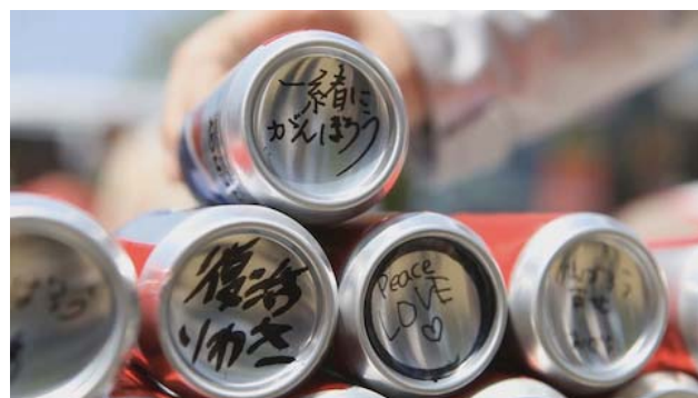
試飲後、缶底にメッセージを記入します