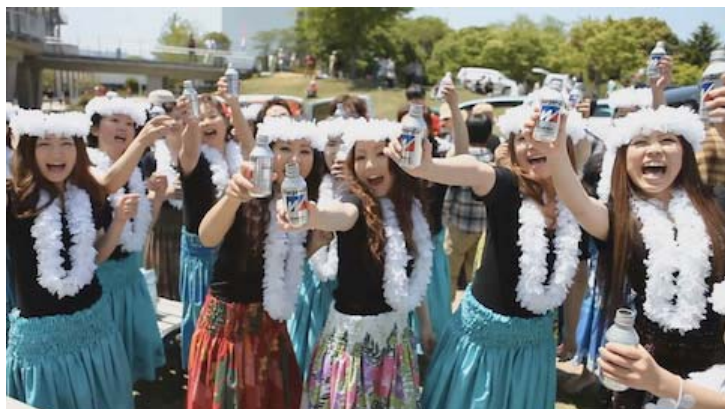
市内各地での試飲風景