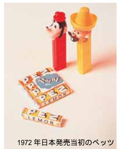
1972年日本発売当初のペッツ