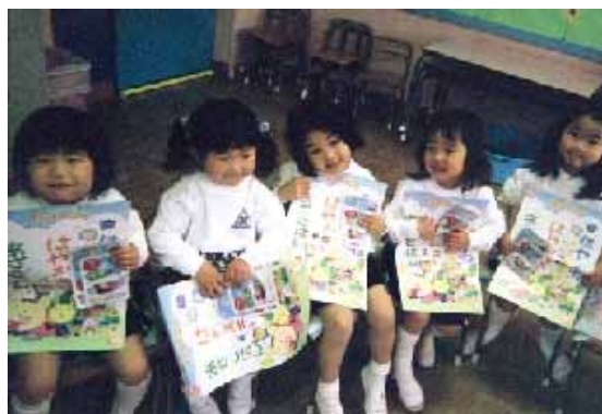
幼稚園サンプリングの様子(千葉県柏市・ホザナ幼稚園)

「牛乳で飲むココア」は、子どもの大好きなココア味なので、牛乳嫌いの克服にも効果的です。