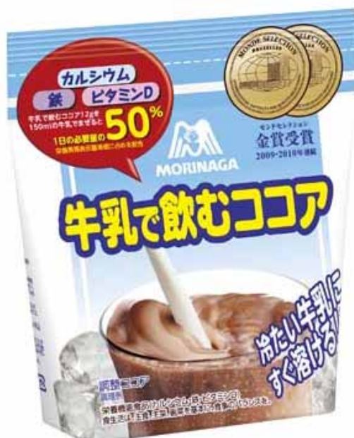
牛乳で飲むココア

森永製菓は、「牛乳で飲むココア」で子どもたちの健やかな成長をサポートしていきます。